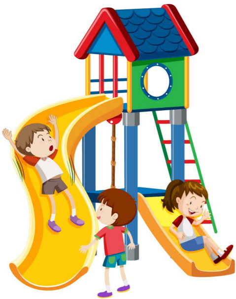
playground oyun alanı