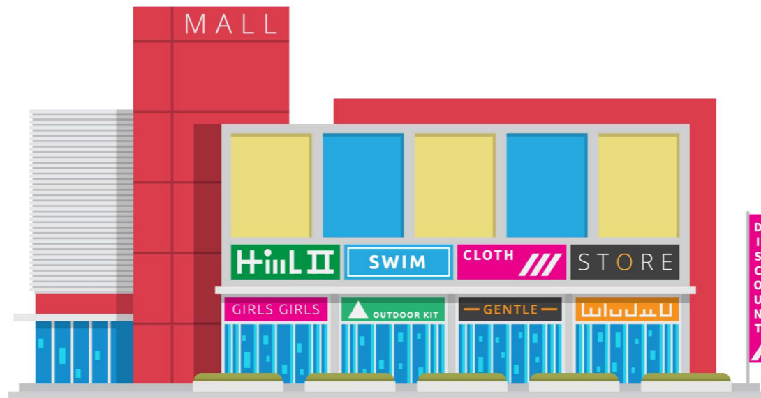
shopping mall alışveriş merkezi