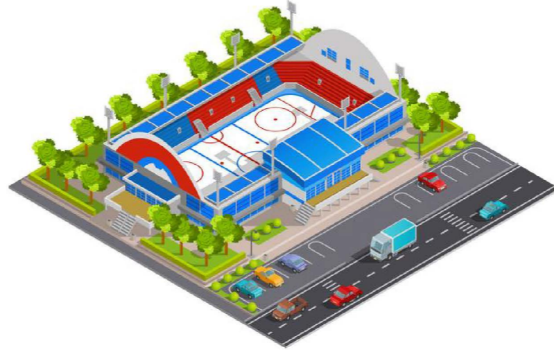
sports complex spor kompleksi